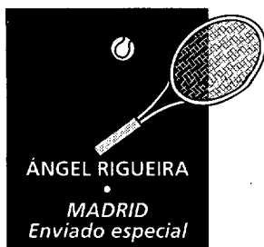
ÁNGEL RIGUEIRA MADRID Enviado especial

temporada, rompiendo una racha negativa que databa del US Open del pasado mes de septiembre, y el tercero de su carrera profesional sobre tierra batida, la superficie que menos se adecuaba al poderoso juego de saque-volea. Se marchó de las instalaciones del CT Chamartín sin ceder un solo set y con la convicción de que está por el buen camino para conseguir este año el único Grand Slam que todavía no figura en su palmarés: Roland Garros.