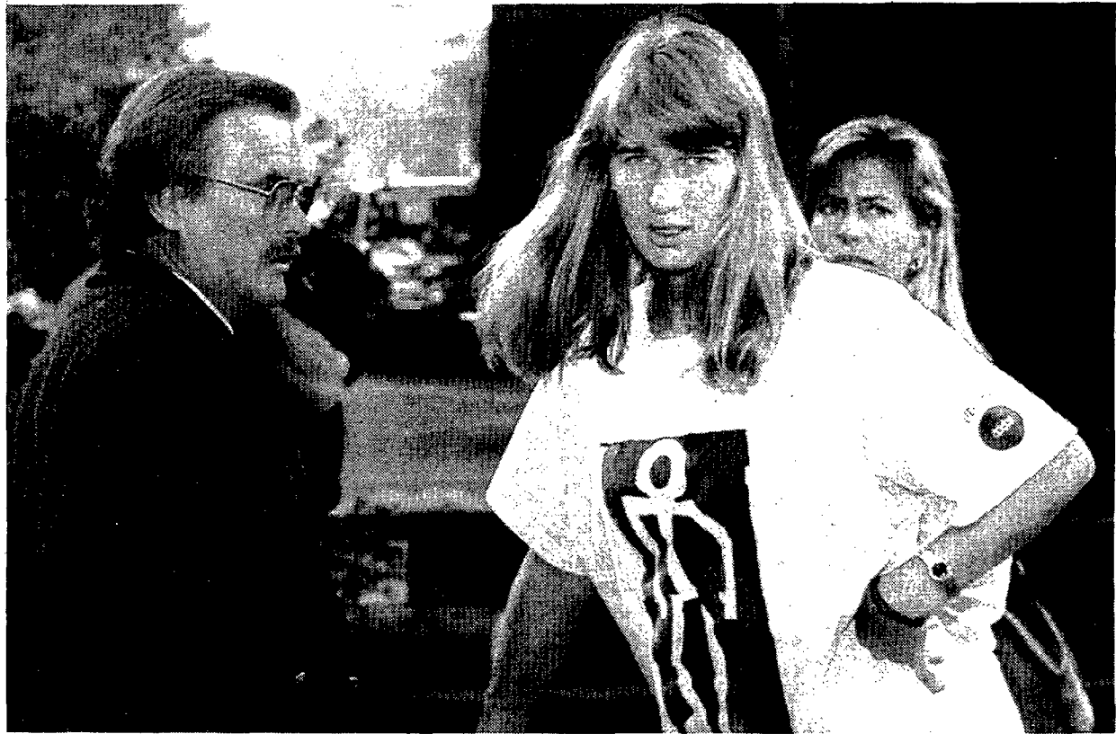
Steffi Graf visitó ayer a Monica Seles en el hospital Universitario de Hamburgo

Por otra parte, se decidió, tras acuerdo de todas las tenistas, seguir disputando el torneo. Graf y Arantxa Sánchez disputarán la final tras derrotar, respectivamente, a Novotna, por 6-3, 3-6 y 6-1, y a Magdalena Maleeva, por 6-2 y 7-6 (7-4). ●