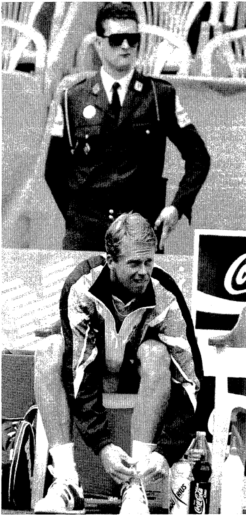
Stefan Edberg gozó en Madrid de medidas especiales de seguridad

Edberg continuó ayer, sobre la pista central del Real Club de Tenis